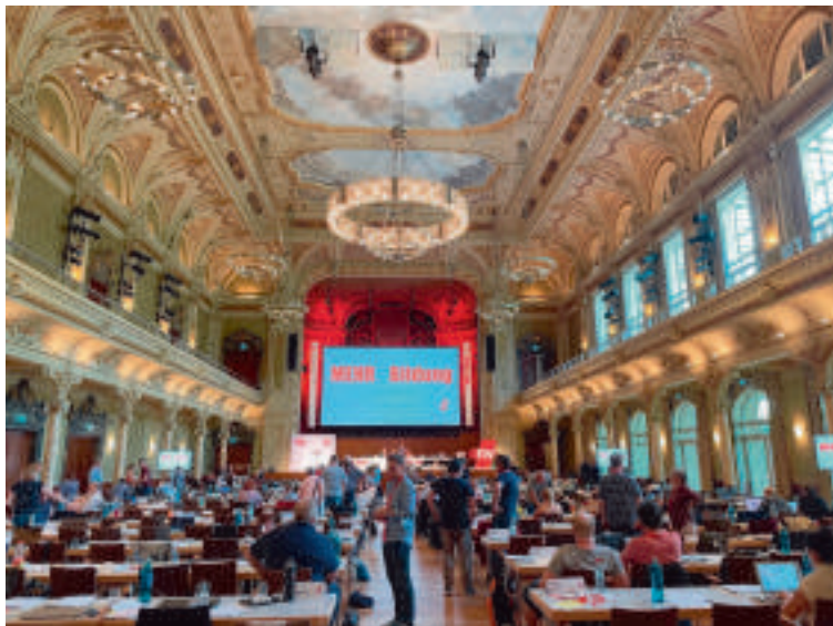
Ein Blick in die prächtige Wuppertaler Stadthalle

Insgesamt standen rund 87 Anträge aus allen Bereichen der GEW zur Beratung an. Sie waren thematisch gebündelt und beschäftigten sich mit Bildungspolitik, Tarifpolitik, Bildungsfinanzierung, Lehrkräfteaus- und fortbildung und Organisationspolitik der GEW. Ein Gewerkschaftstag ist eine sehr basisdemokratische Angelegenheit, da sind zuweilen auch mal Geduld und Ausdauer gefragt. Die Mettmanner GEW war mit fünf delegierten Personen vertreten.